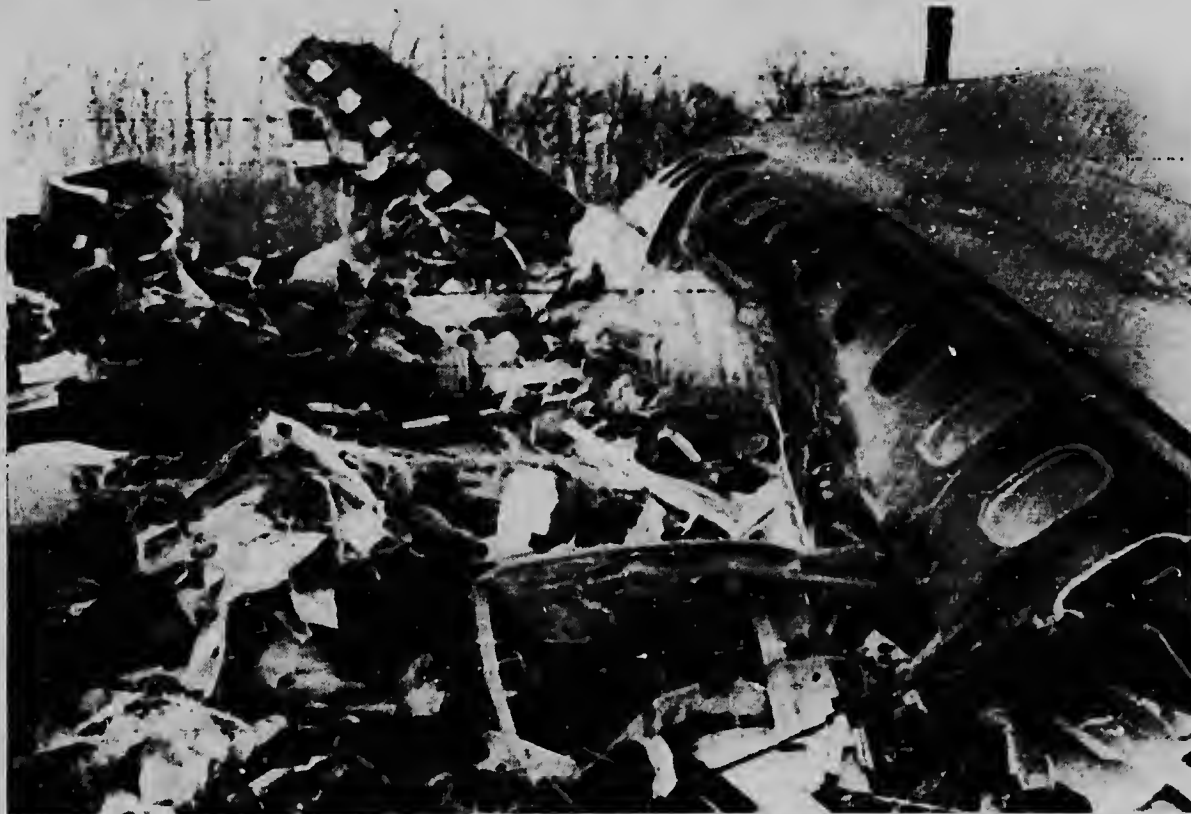
Monte Fuji, Japon -- Aki nos por mira un closeup di e avion Jet accidentá na pia di Monte Fuji. Tur e 124 personanan cu tabata a bordo a muri. Esaki ta e di dos desaster aereo den dos dia.

E candela no por a ser domina sino te 5 o or di atardi, tres ora despues dje desastre.